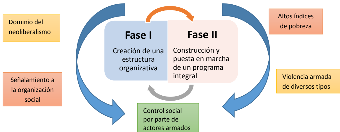
Figura 1. Fases para la implementación de la propuesta – contexto en el que se desarrolla